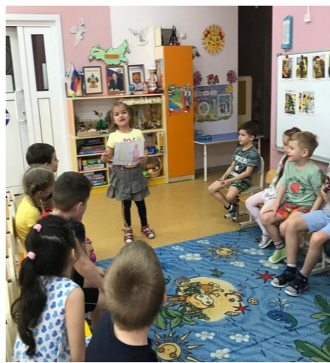
Рассказы детей о профессиях родителей