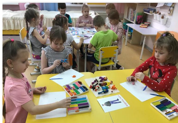
Работа в мастерской по созданию героев и атрибутов

Вывод в конце дня. Интересно быть мультипликатором, нужно много людей и подготовки для съемки мультфильма. Принимается решение подключить родителей к изготовлению и подбору атрибутов и декораций к мультфильму.