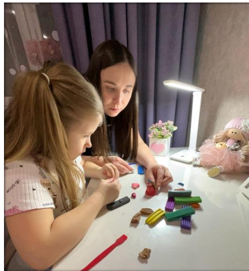
Совместная деятельность детей и родителей в процессе подготовки героев мультфильма