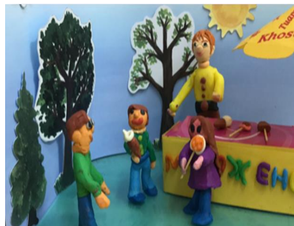
Кадры из мультфильма «Когда я вырасту большим»

Беседа в конце дня. Кто был активнее? Почему некоторые ребята не проявили должной активности (тема не нравится, родители не помогали, не интересно)? Какая деятельность